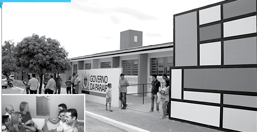
Aeroesimulação da Escola Estadual Integral Seráfico Nóbrega formina, graçaspelo governador Ricardo Coutinho, beneficiando mais de 200 estudantes da cidade de São Mamede