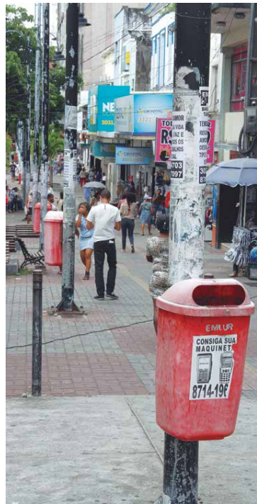
Na Avenida Duque de Caxias é comum encontrar papeleiras velhas e sujas.