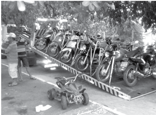
Durante a operação Duas Rodas, realizada em vários municípios, 56 veículos foram recolhidos ao pátio da PRF