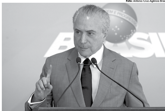
Presidente Michel Temer fez pronunciamento à imprensa no Palácio do Planalto, onde falou sobre vários temas

Temer informou ainda que a Casa Civil está finalizando um projeto de lei que vai regulamentar o direito à greve no caso de serviços considerados essenciais, tanto no âmbito federal como estadual e municipal.