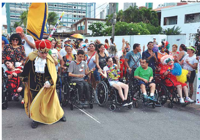
O Bloco Portadores da Folia vai desfilir pela orla da capital no dia 21, na terça-feira da próxima semana, durante o Folia de Rua