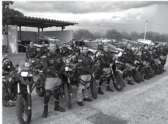
Em apenas três dias, diversas irregularidades foram verificadas no Sertão pelos policiais rodoviários federais