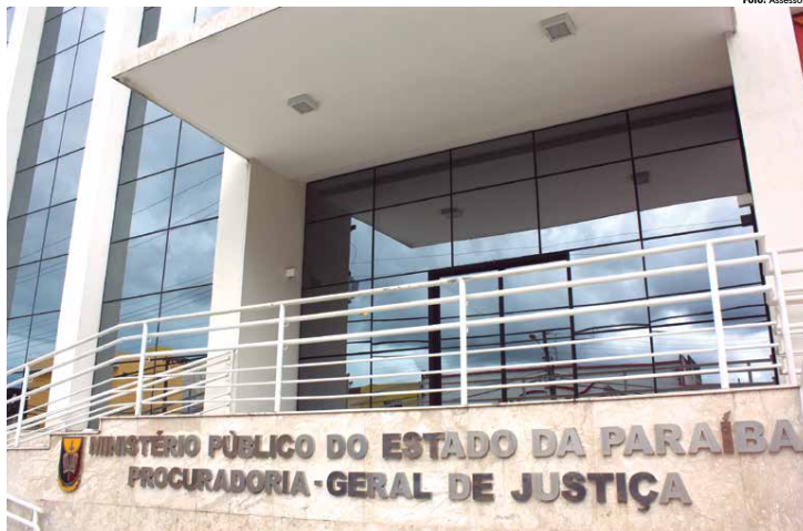
Os eventos do Hackfest são uma iniciativa do Núcleo de Gestão do Conhecimento do MP e o objetivo é realizar uma maratona de programação

"Os eventos do hackfest são uma iniciativa do nosso Núcleo de Gestão do Conhecimento que nós criamos. O promotor de Justiça Octávio Paulo Neto