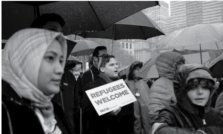
Imigrantes intensificam protestos nos Estados Unidos contra o decreto do presidente Donald Trump, que proíbe a entrada de eles no país

A polêmica lei prevê apenas uma punição administrativa pelos casos de abuso de poder inferiores a 44 mil euros.